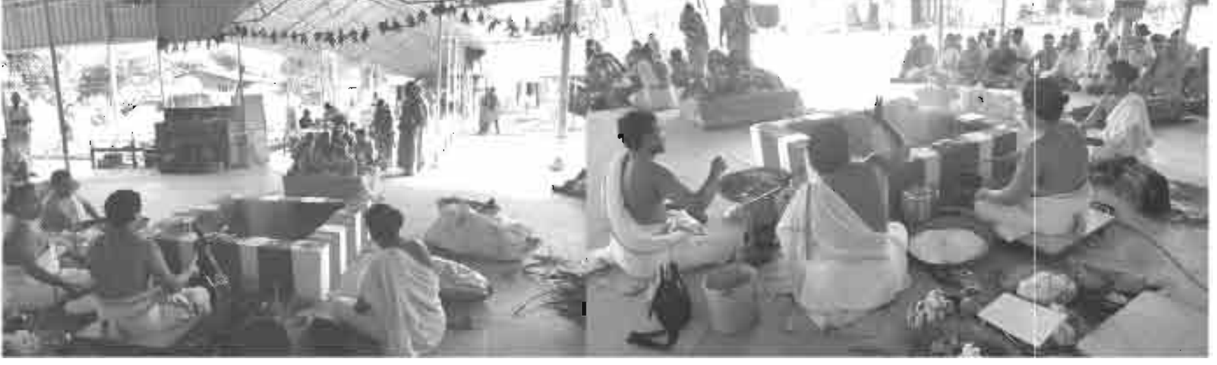
19-12-17 சனிபெயர்ச்சி அன்று சனிஸ்வர சாந்தி ஹோமம் சக்திபீடத்தில் விமரிசையாக நடைபெற்றது.